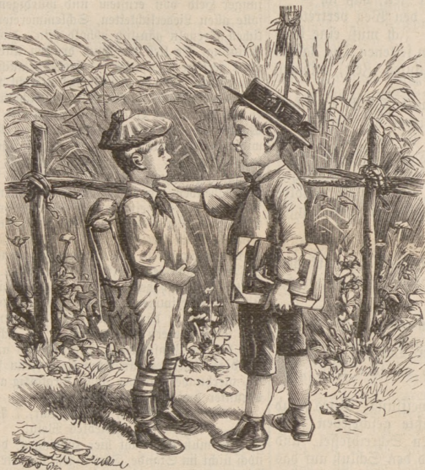
Auch ein Festtagsvergnügen.

Adolph: Du Karl, heute habe ich Geburtstag, da geh'n wir 'mal für fünf Mark zusammen über 'n verbotenen Weg!