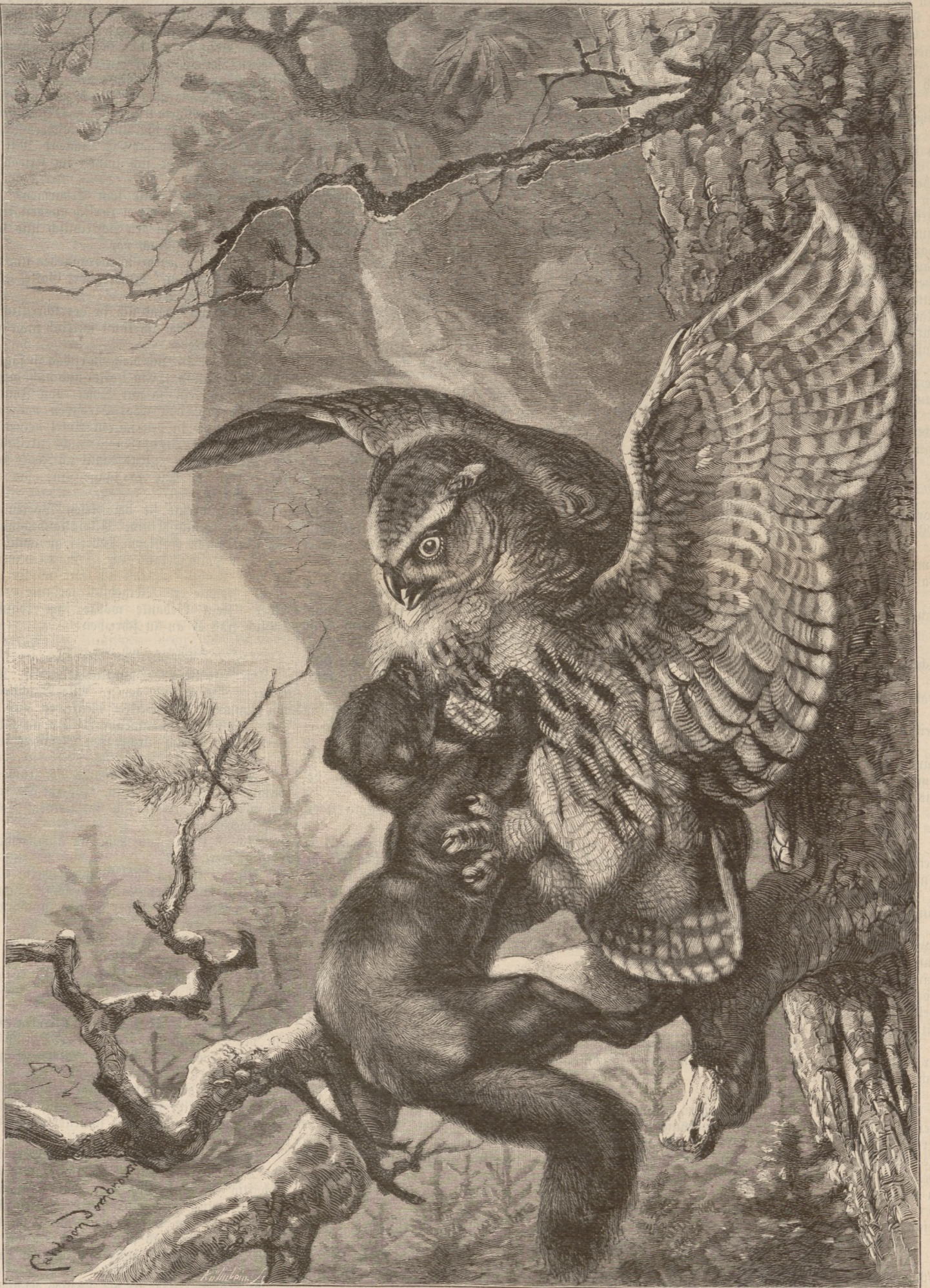
Zweikampf nächtlicher Räuber. (S. 331)