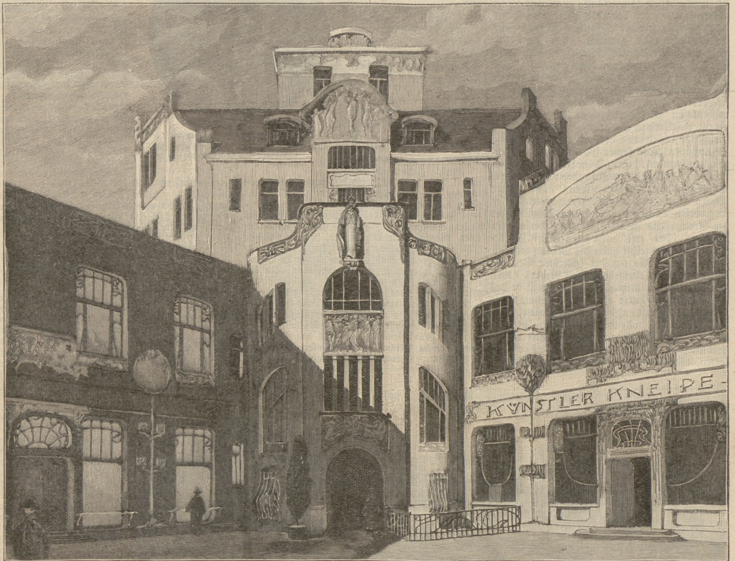
Der Hof des Künstlerhauses in Leipzig. (S. 307)

„Und da geht's hoch her. Drüben in der Kneipe „Zum Känguruh“ ist seit heute früh wieder einmal eine Fünzigpfundnote (tausend Mark) an die Wand genagelt worden mit der Unterschrift: „Zum Vertrinken!“ Die Kerle geben sich, als ich vorhin drüben war, schon in frühester Morgenstunde alle mögliche Mühe, die Note klein zu kriegen,