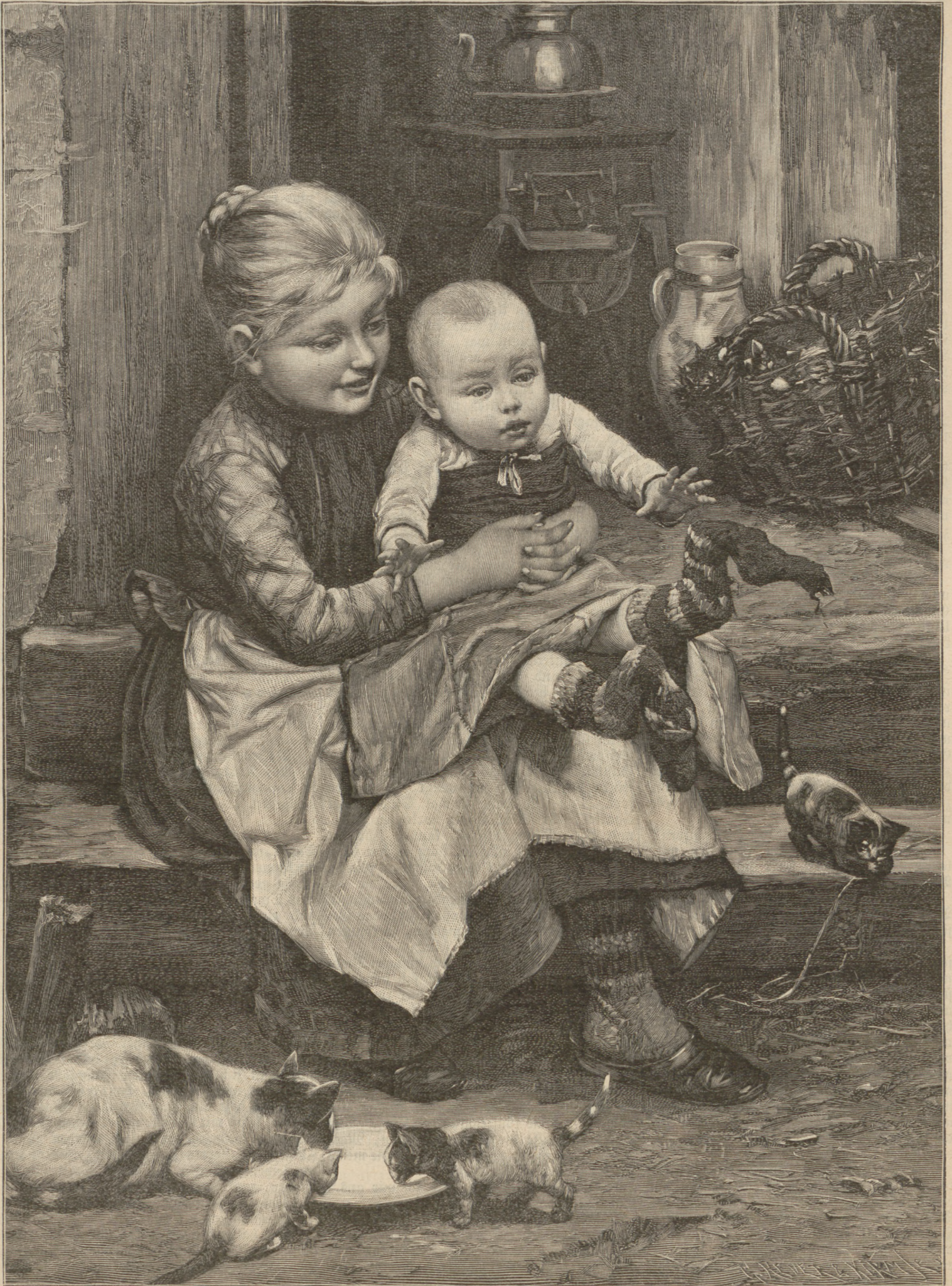
Zuerreichbar. Nach einem Gemälde von B. Genzmer. (S. 307)