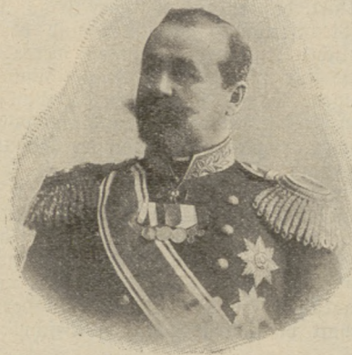
Fürst J. M. Obolensky, der neue Generalgouverneur von Finnland. (S. 307)

Nach einem tiefen Atemzuge, den Blick während seiner ganzen Rede starr auf den Angeklagten richtend, sagte Benjamin Sharp: „Ja, diese Aussage ist erlogen. Niemand kann das besser wissen, als ich, der ich sie dem Manne eingepägt habe. Er hat das blutige Tuch nicht gefunden, sondern er hat es aus meinen Händen empfangen, wie ich es von dem schwarzen Aufwärter aus dem Metropolitan-Hause empfing. Nach der Abreise jenes Mannes dort lag es in einer Ecke des von ihm bewohnten Zimmers, und nicht