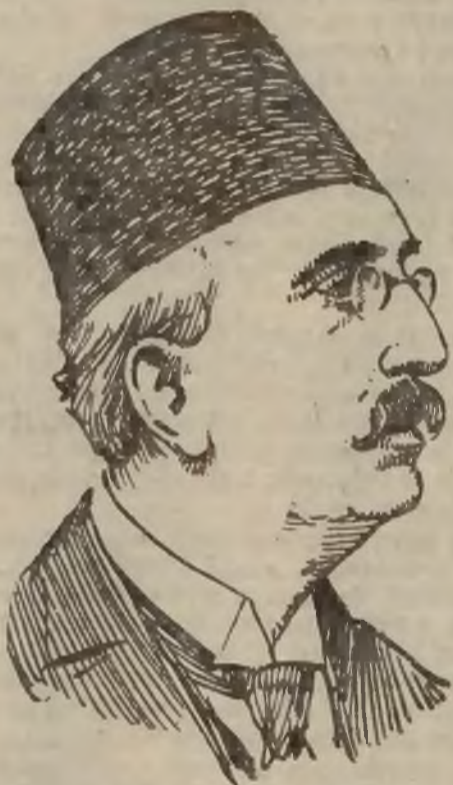
Sultan Mohamed VI.

Panujący od niedługo czasu nominalny władca Turcji, pozbawiony stolicy zajętej przez Anglię i Małej Azji, którą opanowali Kemalisci, zamierza zrezygnować z tronu wobec postępów wojsk Kemala-paszy, zagrażającego już Konstantynopolowi.