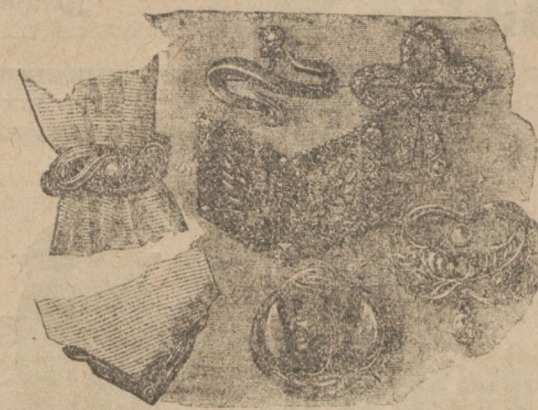
Cravaten-Ringe, Broschen und Schleifen.

Aus dem weiten Gebiet des Schmuckes sind in erster Reihe wieder die fast unerlässlichen Ketten zu erwähnen. Hier ist die Auswahl ebenso mannigfaltig wie die Preise. Um die Mode mitzunehmen wählte man wohl echtes Material, aber nicht zu kostbares: eine silberne Kette oxydirt, event. mit Vergoldung und Halb-Edelsteinen geschmückt, wirkt jedenfalls edler, als eine Gold-Plaqué-Kette. Einen 160 cm lange Uhr-, Ruff-, Fächer-, oder Vornetten-Kette besteht aus verschlungenen vergoldeten Gliedern, in je 10 cm Zwischenraum mit Granat = Cabochons geschmückt. Für jüngere Mädchen sind Ketten aus buntem gemusterten chinesischen Glasperlen sehr reizend. Die vielgetragenen Kugelharnaseln sind ganz aus blühenden Strahlen zur Abend-Toilette erschienen. Unsere, der „Modenwelt“ (Berlin, Franz Zipperheide) entnommene Abbildung stellt neuartige Granaten-Ringe, Broschen, und Gürtelschließen dar. Da ist zunächst ein Cravaten-Ring aus matten dunklen Silber, mit einer Wachsperle zwischen den Bindungen; dazu gehört die Schleife für das Band-Ende. — Den daneben abgebildeten, als Brosche gebachten Blattschmückel formt Tula-Silber mit einem Simili-Jasmin. — Die Schleifenform