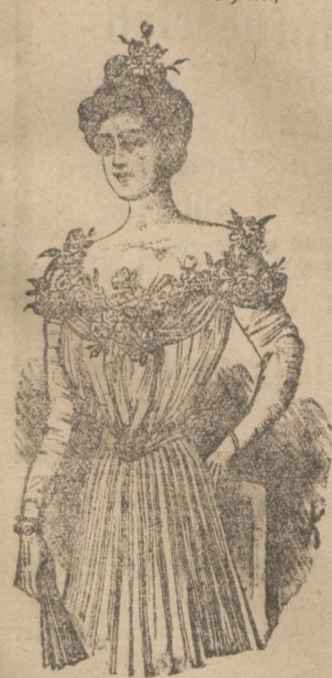
Ballkleid Garnitur aus Platterröschchen.

Mit Geschmack und Bedacht gewählte Toiletten-Gegenstände dürfen stets sicher sein, auf den Geschenktischen junger wie älterer Damen die größte Freude hervorzurufen; vor Allem jene zierlichen Duzen-Dinge, die einer Toilette erst das Fertige geben. Die „Modenwelt“ (Berlin, Franz Zipperheide) bringt nun für Wünschende, wie für die Gebenden in Wort und Bild Anregung in Güte und Gülle. Mit Jubel wird die junge Tochter des Hauses die reizende Garnitur aus Platterröschchen für ihr erstes duftiges Ballkleid begrüßen: die Blüthen legen sich leicht gewunden, um den runden Taillenausschnitt, vorn mit zierlichem