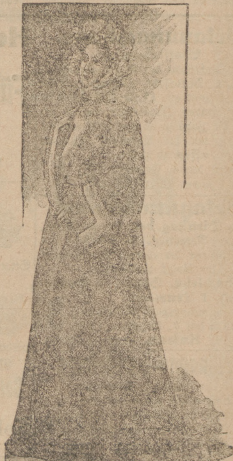
Abendmantel mit „Naglan“-Aermel.

Eine praktische Form von Abendmantel ist ein Aermel-Mantel mit „Naglan“-Schnitt, lose und bequem zum Einschlüpfen wie das bekannte japanische Gewand; „Die Modenwelt“ stellt einen