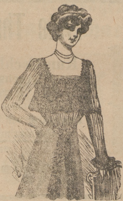
Empire-Jäckchen-Garnitur aus verlegtem Tüll.

des augenblicklich in großem Ansehen stehenden Prinzesskleides bildet die dargestellte Empire-Jäckchen-Garnitur. Unsere Vorlage — so beschreibt die „Illustrierte Frauen-Zeitung“ eine Jäckchen-Garnitur — besteht aus verlegtem Tüll: ein 18 cm breiter Bolant ist auf Oberweite eingereicht mit 3 cm hohem Köpfchen, eine Filletterborte besetzt