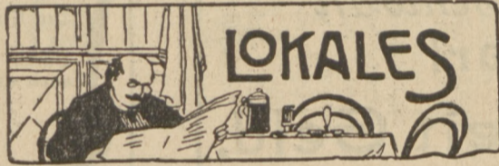
Thorn, den 13. Februar.

bekamen sie eine Tracht Prügel. Eine Frau und der unglückliche Verliebte liegen nunmehr schwer krank darnieder.