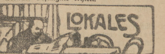
Thorn, 3. März.