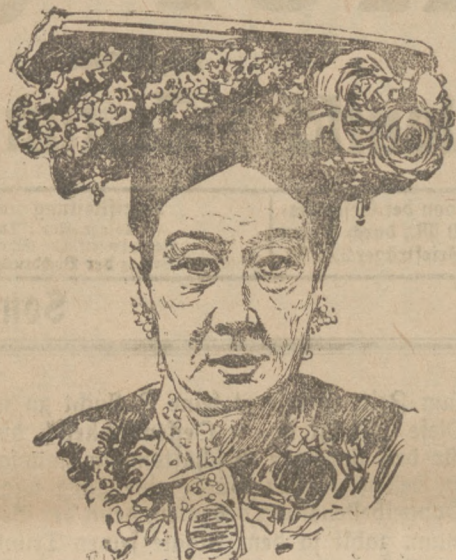
Tzu-si Kaiserin-Witwe von China

Jeng; sie hatte sich durch ihre Klugheit das Vertrauen des Kaisers in hohem Maße erworben und wurde schließlich von dem Range einer Nebenfrau zu dem der Kaiserin und Mit regentin erhoben, wobei sie vom Jahre 1881 tatsächlich die Alleinherrscherin in China