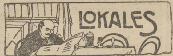
Thorn, den 18. Oktober.

Stolz, 18. Oktober. Eine Explosion entstand in einem Wagen 3. Klasse des von Danzig kommenden Personenzuges. Als kurz hinter Schlawe die Beleuchtung des Wagens angestellt wurde, explodierten mit furchtbarem Knall zwei Gaslampen. Durch die umherfliegenden Glassplitter erlitten zwei Reisende leichte Verletzungen, während die übrigen mit dem Schrecken davonkamen.