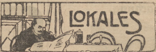
Thorn, 10. Juni.

Posen. Leichte Schnellfeuer- und Revolverkanonen werden, nach der „P. Z.“, bei der großen Festungskriegsübung bei Posen eine wichtige und eindrucksvolle Rolle spielen, wobei man auch in dieser Hinsicht von neuen Gesichtspunkten ausgehen wird, die sich ebenfalls aus der Belagerung von Port Arthur ergeben haben. Die leichten Schnellfeuerkanonen werden bei der Festungsübung bei Posen vorwiegend zur Unterstützung der frontalen Infanterieverteidigung dienen. Ihre Vorzüge bestehen in einer vernichtenden Kartätschwirkung auf nähere Entfernungen und darin, daß sie geringen Raum und wenig Personal zur Bedienung beanspruchen. Sie werden bei der großen Festungskriegsübung bei der Verteidigung vorwiegend in ständig angebauten oder in fahrbaren Panzerfahrzeugen Verwendung finden, beim Angreifen in fahrbaren Panzerfahrzeugen zur Unterstützung der Infanterie bei Festhaltung und Sicherung gewonnener Abschnitte und Stellungen. Die Revolverkanonen aber werden bei der Festungskriegsübung vorwiegend zur Flankierung von Hindernissen, besonders von Festungsgräben, dienen. Sie sind zu diesem Zwecke in Kasematten mittels Pivotlafetten aufzustellen und feuern durch Scharten. Ihre vernichtende Feuerwirkung auf nähere Entfernungen, ihre geringer Raumbedarf und die Handlichkeit der Bedienung machen sie hierfür besonders geeignet. Sie sind den früher als Streichgeschützen gebräuchlichen glatten und gezogenen 7 bis 9 cm-Kanonen ganz erheblich überlegen.