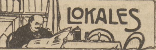
Thorn, den 13. Juni.