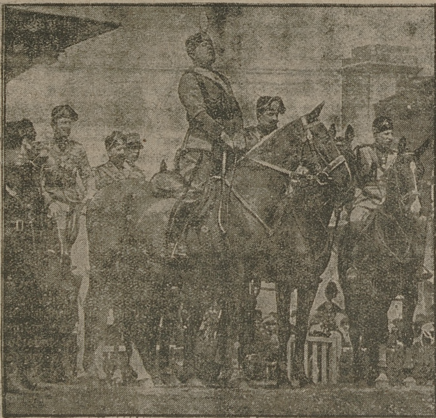
Mussolini na koniu przemawia do 50.000 zebranych faszystów.