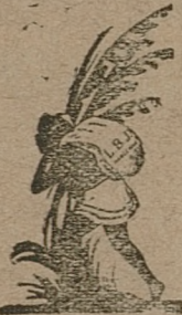
Rok założenia 1887.

powierzyliśmy wyłączną sprzedaż kawy naszej firmy w oryginalnym opakowaniu, po cenach fabrycznych.