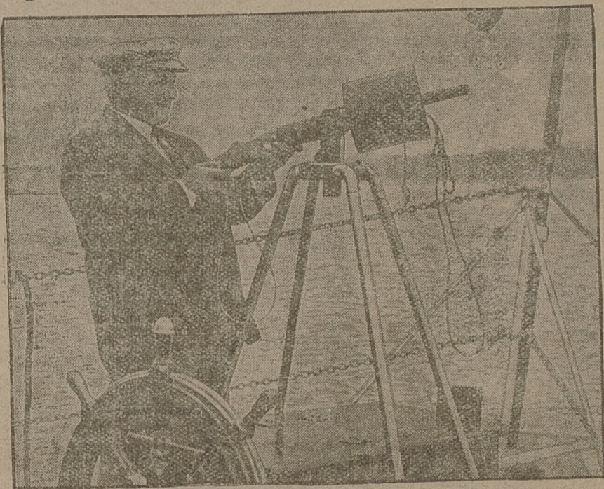
Łudzie te, spieszące na ratunek zagrożonym okrętom i kutrom rybackim wyposażono ostatnio w rakiety ratunkowe.