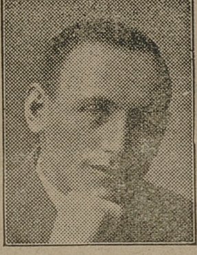
Pan W. D.: Wypróbowałem wszystkie inne środki, dopiero po zastosowaniu zalecanej przez W.Panów kuracji-włosów poszczydzić się mogę wspaniałą czupryną. (Słowa te potwierdza załączonymi fotografiami które podajemy).