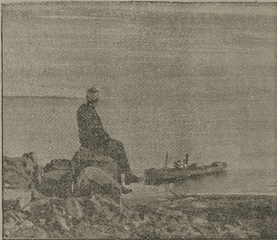
20 lipca sowiecki łamacz lodu „Małygin“ ma przedsięwziąć nową wyprawę do bieguna. Poraz pierwszy „Małygin“ zabierze z sobą pasażerów.