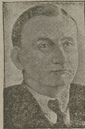
GROŹBA NOWEGO KONFLIKTU MIEDZY POLSKA A GDANSKIEM.

Doniesienia z Nowego Jorku przedstawiają bitwę o Gibara o tyle inaczej, że mówią o 500 poległych powstańcach.