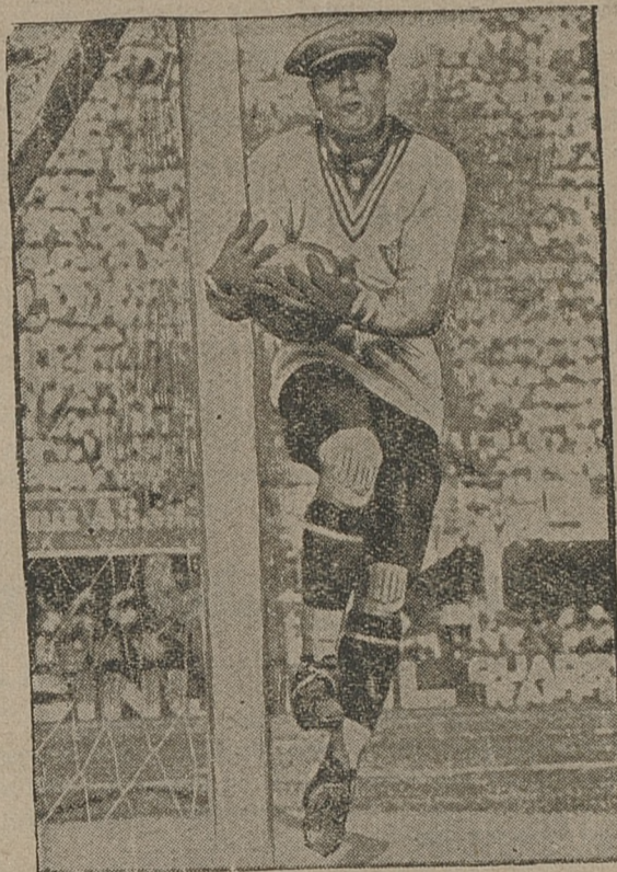
W Berlinie bawi obecnie reprezentacja piłkarska Madrytu, w której gra naj-słynniejszy bramkarz europejski Zamora.