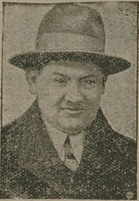
Sp. poseł Tadeusz Hołowki, zamor- dowany skrytobójczo w Truskawcu.

WARSZAWA, 1. 9. (wł.) Wczoraj o godz. 3 popoł. odbył się pogrzeb ś. p. tragicznie zmarłego p. pośle Tadeusza Hołównki. Już o godz. 2 popoł. przed dworcem głównym, gdzie znajdował się wagon, kryjący zwłoki ś. p. Hołównki, zebrały się olbrzymie tłumy, oczekujące na wyruszenie konduktu pogrzebowego.