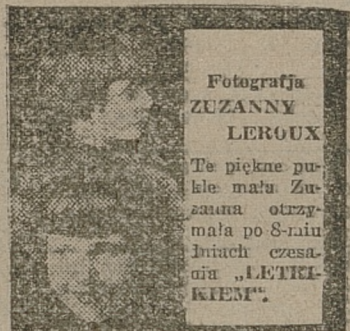
Letrik jest idealny dla dzieci

Już po kilku dniach czesania grzebieniem elektrycznym „LETRIK”, włosy zaczynają falować, a po dłuższym użyciu pojawia się piękna, wieczna ondulacja. Miejsca łysiejące, o ile cebulki nie są zupełnie zamarte, po tygodniu pokrywają się nowym, zdrowym włosem, lepiej ginie bezpowrotnie, wszelkie choroby włosów zanikają. Matowy włos nabiera połysku, siwiejące zaś włosy po miesiącu odzyskują swą barwę naturalną.