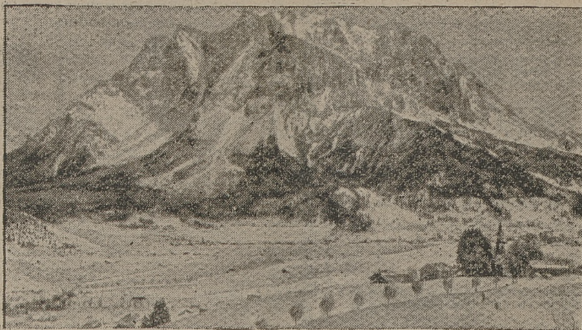
W Bawarii nęczeniwanie spadł śnieg, kryjąc ziemię 10 centymetrowym puchem.

POSZUKUJE miejsca mamki. Wiadomość Sosnowiec, Przc. Mościeckiego 29.