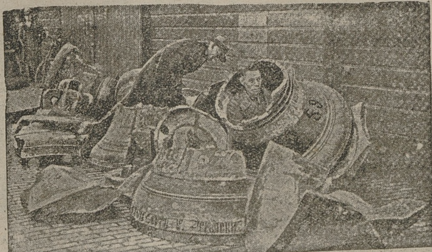
Rząd sowiecki sprzedał do Francji zabrowane dzwony, które będą przetopione. Ilustracja przedstawia rozbite dzwony przed załadowaniem w Leningradzie.

SZKOŁKI ROGOŹNICZKIE TOWARZYSTWA GÓRNICZO-PRZEMYSŁ „SATURN” mają tania do zbycia większą ilość drzew i krzewów owocowych i ozdobnych. Cenniki wysyła się na żądanie. Adres dla listów: Sosnowiec, Tow. Górn. - Przem. „Saturn”, Szkołki Rogoźniczkie.