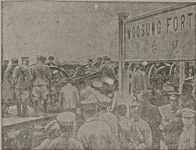
Ilustracja przedstawia stację kolejową fortu Wusong, na której widzimy, wyładowujący się transport artylerji angielskiej, przybyły dla ochrony koncesyj europejskich.