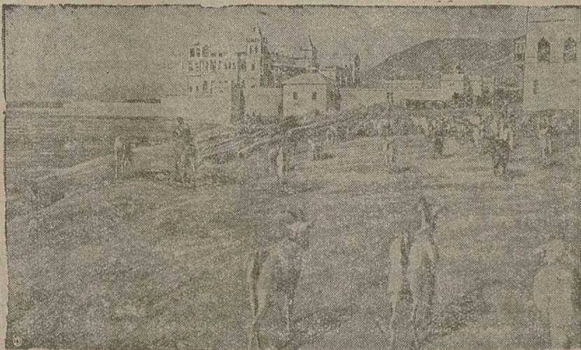
W niedostępnych cyplach Arabji, nad lazurowymi brzegami morza, wznoszą się białe zamki sultana Mahalli.

Zapisy nowych kandydatów (tek) na fachowe