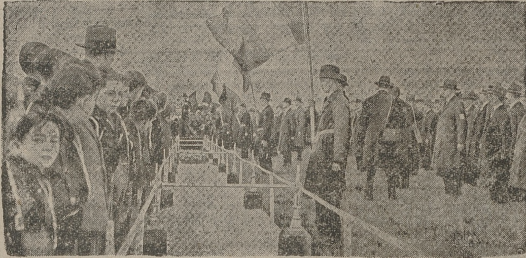
Dublin stanął pod znakiem uczczenia bohaterów, poległych w ruchu wolnościowym w 1916 roku.