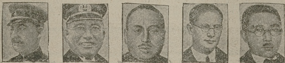
Gen. Uyeda, adm. Nomura, gen. Szirokawa, poseł Sigemetsu, konsul Murai.

LONDYN, 30. 4. (wl.) Zamach na generalicję japońską w Szanghaju odbił się groźnym echem w całej Japonii. We wszystkich miastach odbywają się manifestacje antychińskie i antysowieckie. W Tokio dzienniki wydają bezustannie dodatki nadzwyczajne, zamieszczając komunikaty o postępach śledztwa.