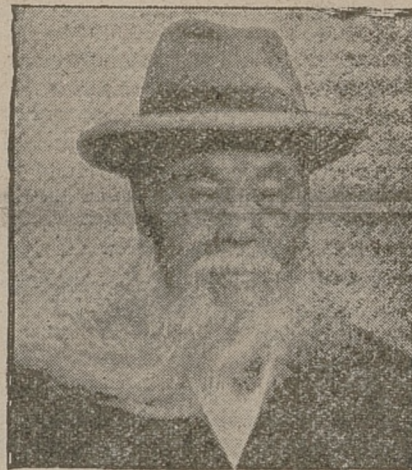
mianowany przez cesarza Japonji premierem na miejsce zamordowanego prem. Junkai.