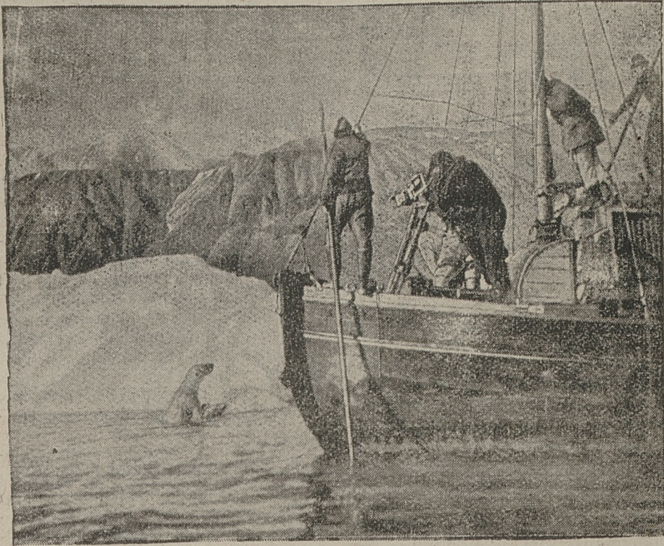
Amerkańsko - niemiecka wyprawa filmowa do krajów północnych, chcąc filmowanymi scenami nadać więcej życia, musiała do zdjęć pożyżyć z cyrku Hagenbecka prawdziwych niedźwiedzi białych. Na ilustracji widzimy filmowanie takiego niedźwiedzia, który, wychowany w niewoli, nie może się wygramolić na lodowiec.