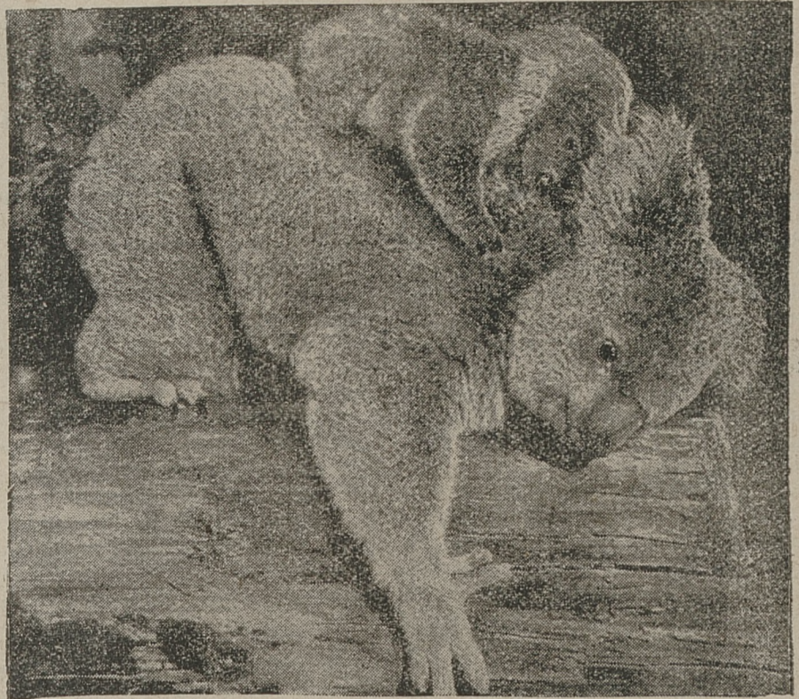
Oto idylliczny obrazek z życia niedźwiedzi w parku Koala w Sydney (Australia).