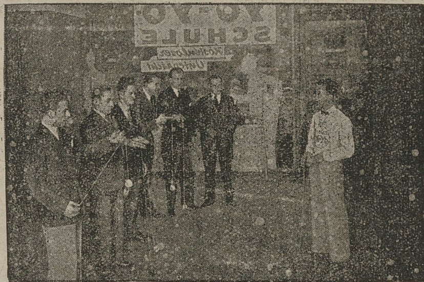
W Berlinie, ku uciesze zwolenników tej zabawki, otwarto szkołę yo - yo. Na ilustracji widzimy poważnych panów z krążkami i sznureczkami w rękach. Lekcję udziela japończyk.