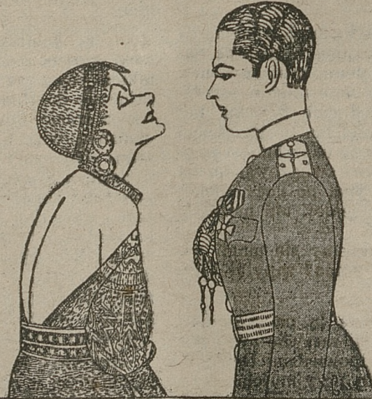
Greta Garbo i Ramon Novarro w filmie „Mała Hari” wylwornii Metro-Goldwyn-Mayer