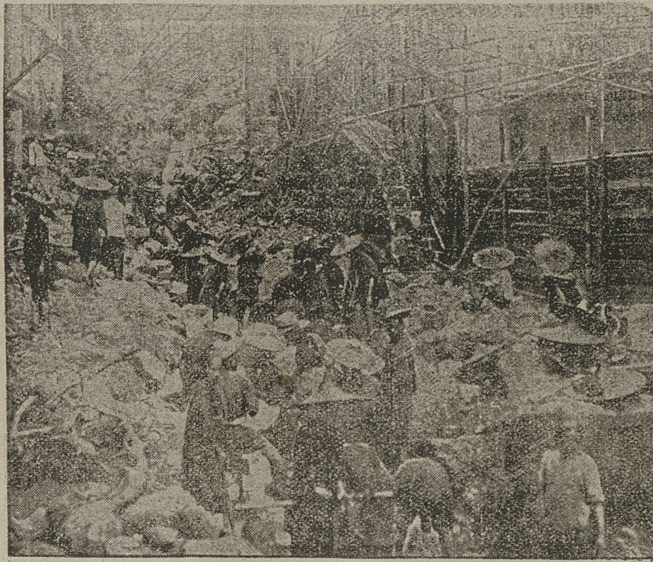
Japonja dotknięta znów została trzęsieniem ziemi. Miasto Komatsuzaki legło całe niemal w gruzach. Zdjęcie, przesłane drogą radiową przedstawia jedną z ulic, zasypaną rumowiskiem i szczątkami spicętów.