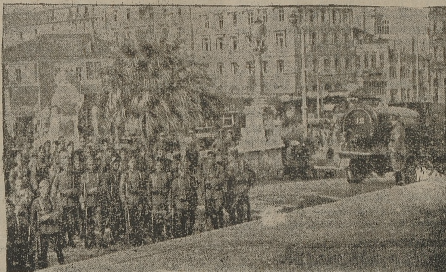
Fotografem prasowym udało się utrwalić na kliszy niektóre momenty z krótkiej rewolucji w Grecji. Ilustracja przedstawia sikawkę policyjną i oddział żołnierzy skonsygnowany w celu rozprzyszczenia demonstrantów.