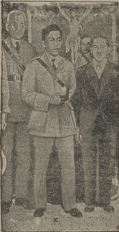
Prezydent Peru, (w środku na ilustracji), który, jak donosiliśmy padł ofiarą zamachu.