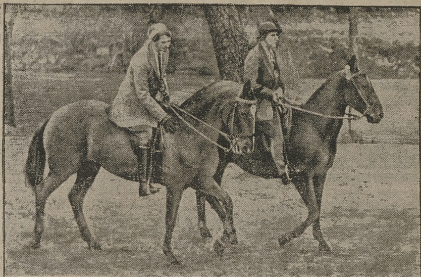
Plec piękna z coraz większym zapalem uprawia sport konny. Miło jest bowiem na dziarskim koniu pohasać po polach lub cienistych alejach.