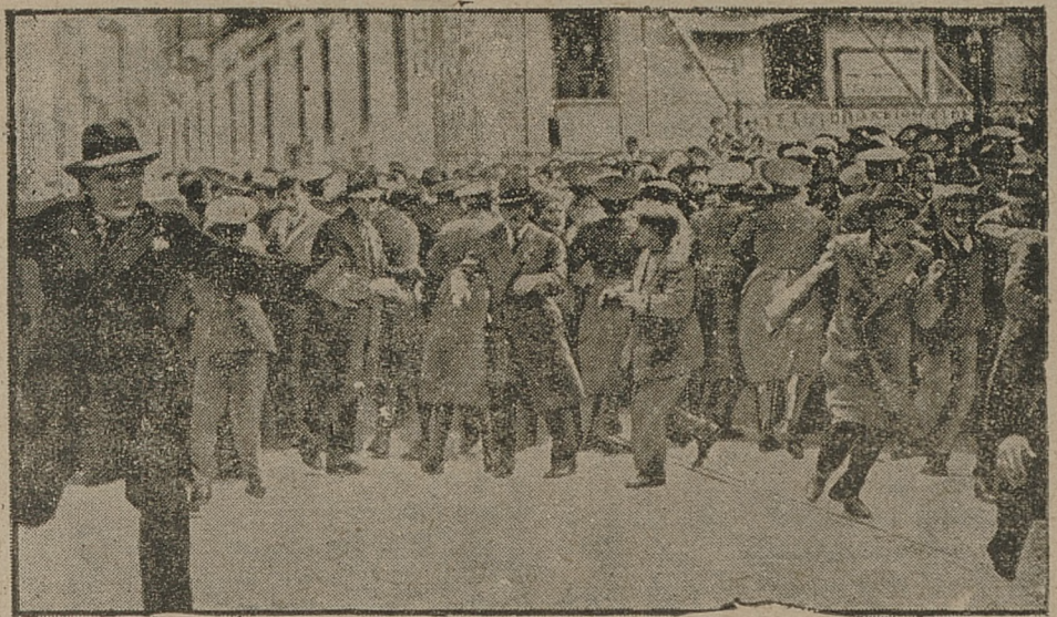
Co powien czas w Hiszpanji komuniste wywołują rozruchy, konczące się nierazdo krwawo. Ostatnie rozruchy zostały stłumione dość szybko przez skonsygnowane oddziały policji. Na ilustracji chwila rozpraszania tłumy.