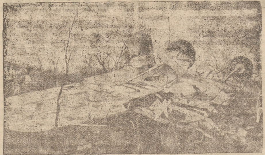
Wielki transportowiec powietrzny, utrzymujący komunikację w kolonjach francuskich w Afryce, uległ katastrofie.