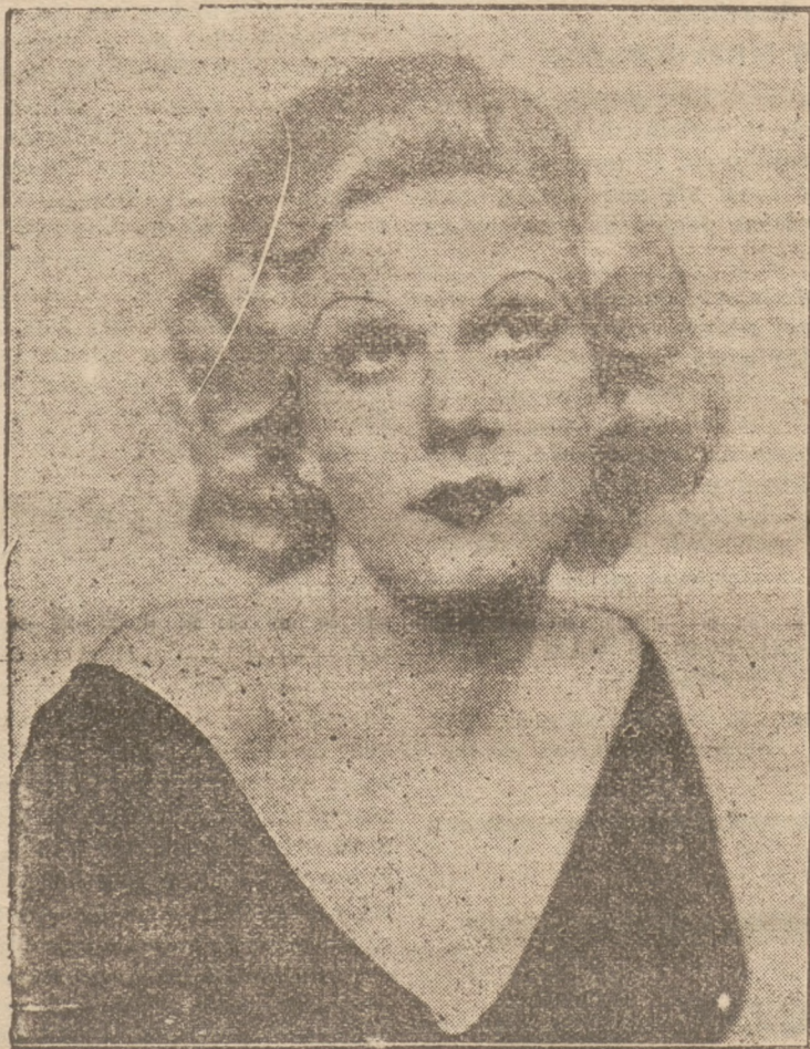
Znana gwiazda filmowa Merna Kennedy zmieniła męża poraz siódmy. Nawet w świecie filmu jest to rekord.