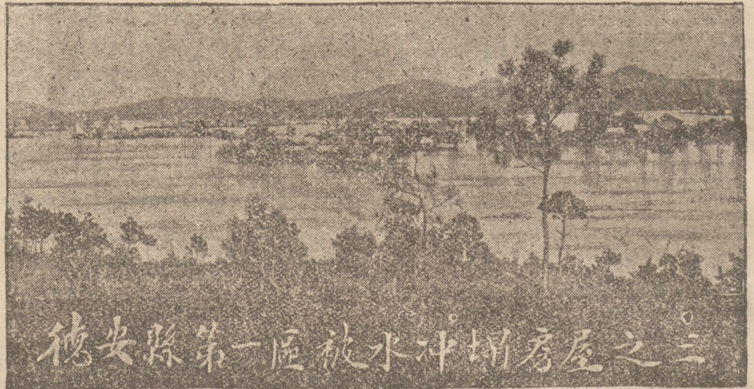
德安縣第一區被水冲塌房屋之三

Jak to już donosiliśmy, w południowo - wschodniej części Korei, wskutek ulewnych deszczów nastąpiła gwałtowna powódź. Jednocześnie nawiedziło Japonię trzęsienie ziemi, które poczyniło duże szkody. Ilustracje nasze przedstawiają dotknięte powodzią i trzęsieniem ziemi okolice.