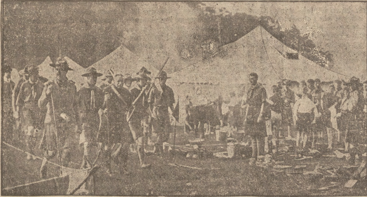
przygotowują się do wyjazdu na Jamboree na Węgrzech w Gödöllö. Obecnie już urządzane są obozy treningowe, zwiedzane przez władze skautowe, jak to widzimy na ilustracji.