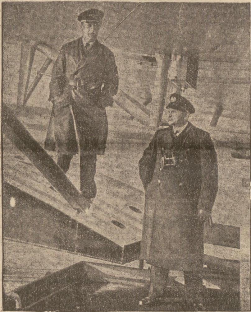
Na oceanie Spokojnym Niemcy zainstalowali pływającą wyspę — okręt na którym lądować mogą samoloty, przelatujące do Ameryki Południowej. Na ilustracji dowódca okrętu i I oficer.