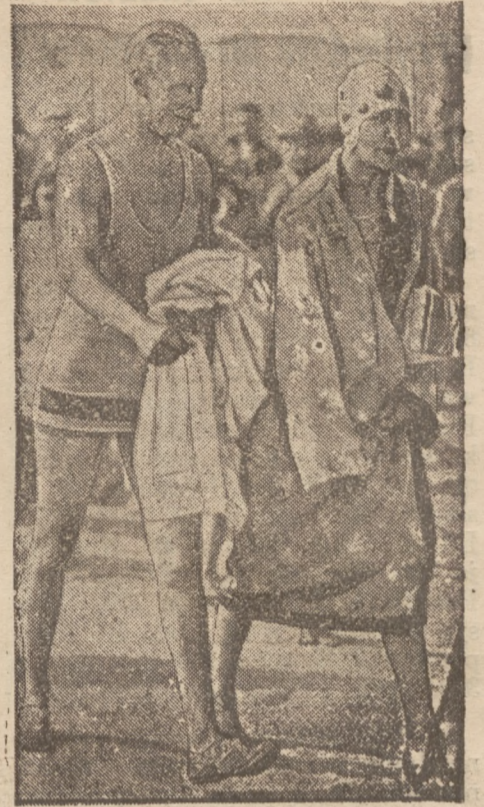
...memiecki po strachu życia politycznego — spędza czas nad morzem.