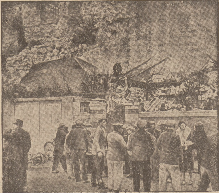
przeszedł nad miastem Alabama orkan, który poczynił znaczne szkody.