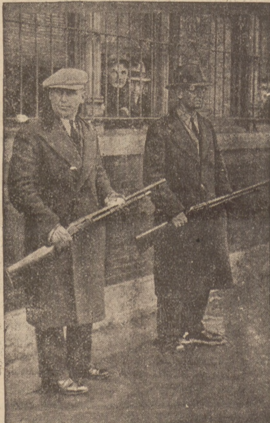
trwają w dalszym ciągu rozruchy. Na zdjęciu powstańcy strzegą gmachu z aresztowanymi zwolennikami rządu.