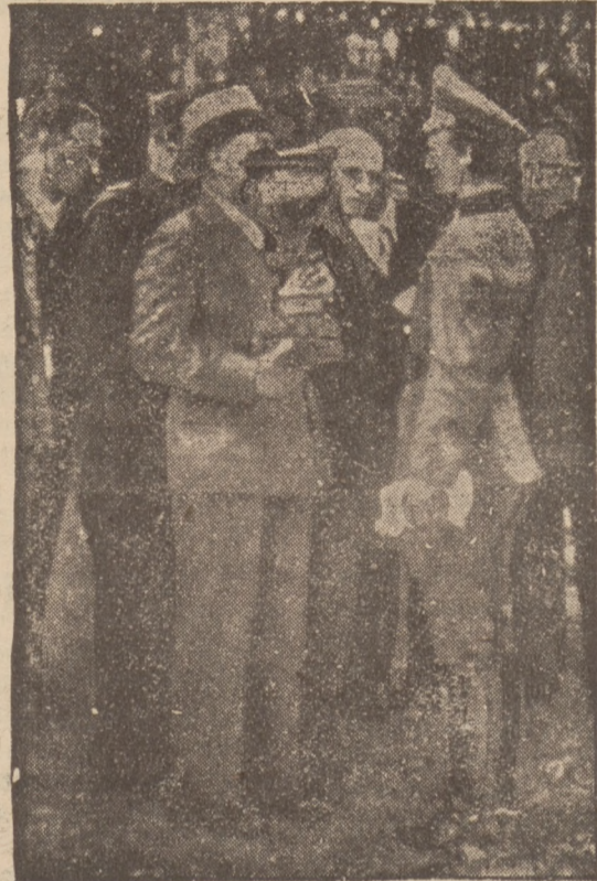
niemieckiej puchar Hitlera zdobył kpt. Erhardt.