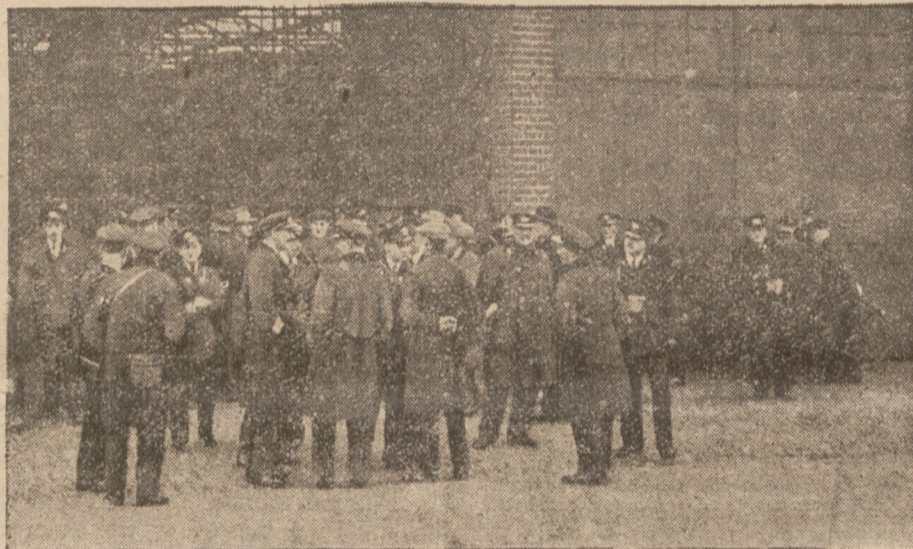
W Paryżu zastrajkował personel autobusów miejskich. Na zdjęciu pracownicy przed garażami omawiają sytuację.