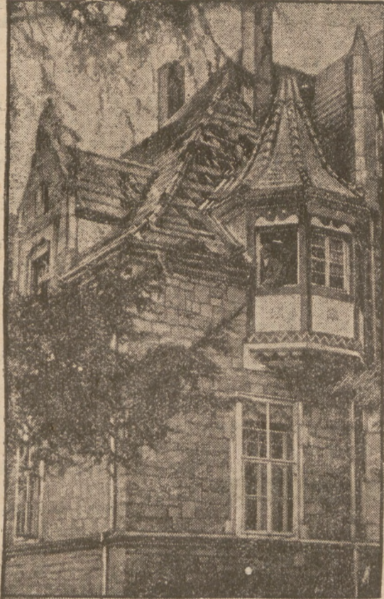
W Wittenbergu dało się odczuć lekkie trzęsienie ziemi. Na il. 1 straciła willa, w której zapadł się dach.