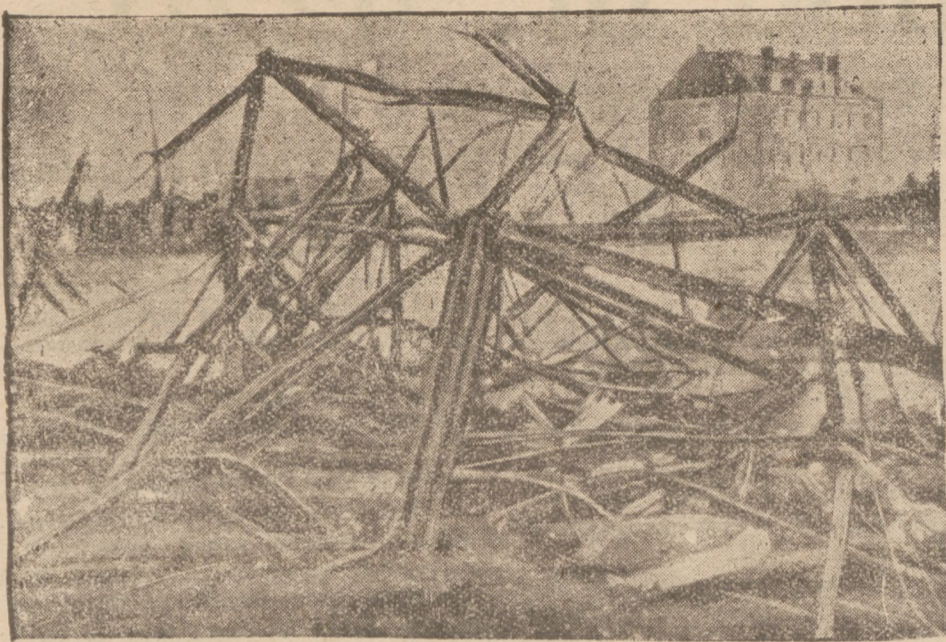
Pod Paryżem wydarzyła się katastrofa samolotowa, w której poniosły śmierć dwie osoby.