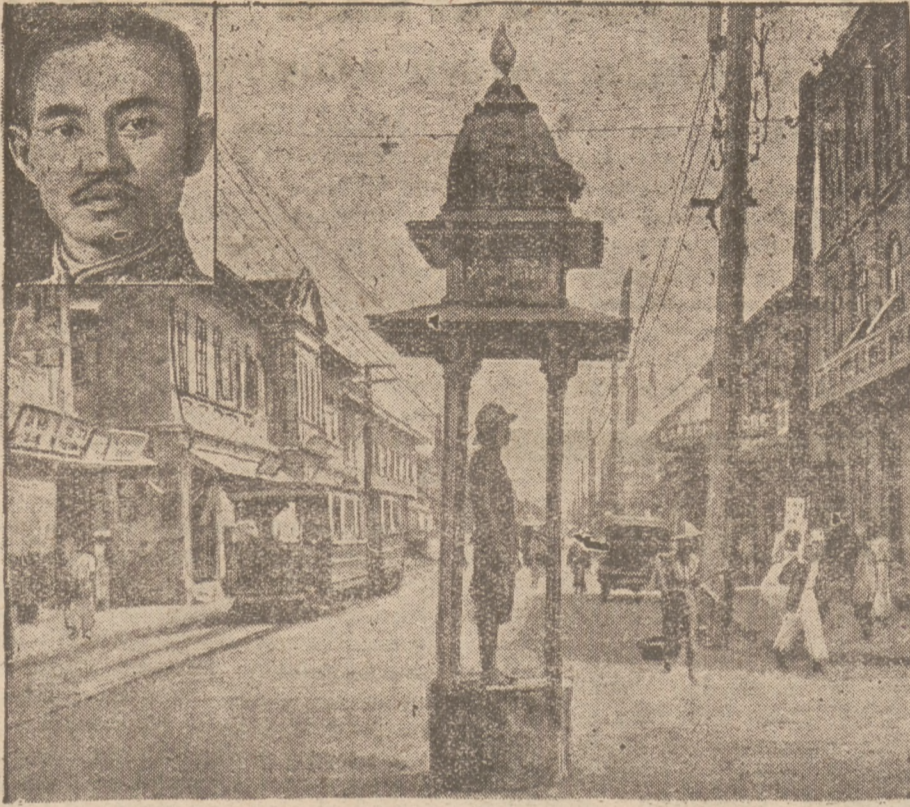
W Sjamie deszło do poważnych zaburzeń. Według ostatnich wiadomości król, którego podobizna znajduje się w kwadracie, wraz z królową zbiegli ze stolicy kraju, Bangkoku — na południe kraju, Na ilustracji główna ulica w Bangkoku, pośrodku policjant, regulujący ruch.