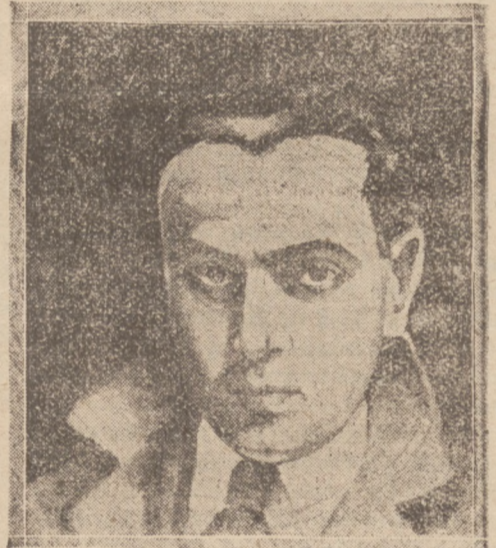
„Autoportret“ — J. Badowera.