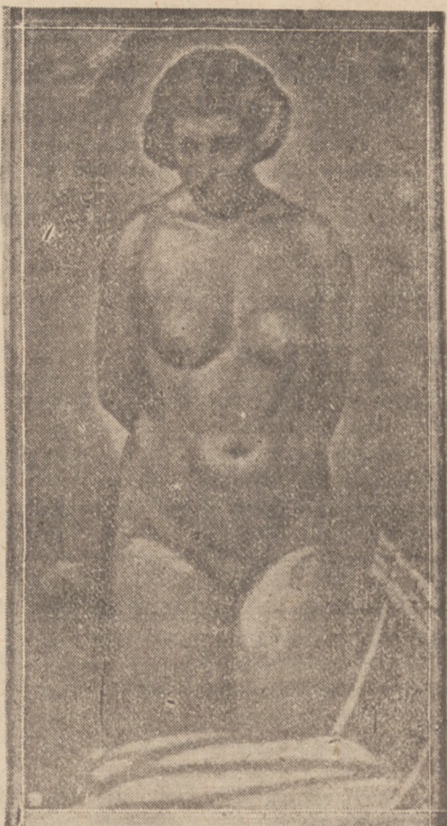
„Akt“ — Władysława Araszkiewicza

Poniżej zamieszczamy reprodukcje dwóch obrazów: