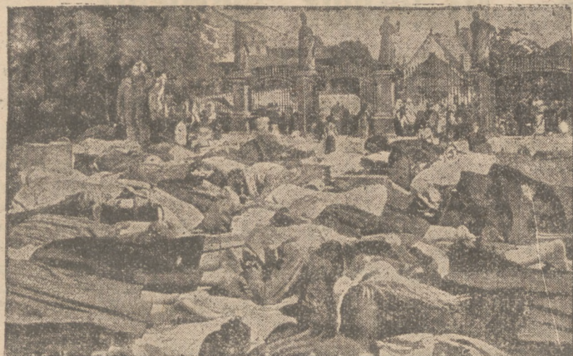
Na ilustracji poranna modlitwa przejeżdżających przez jedno z miast tureckich przekupniów.