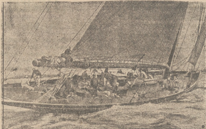
Manewrowanie łodzią żaglową podczas burzy wymagałszy czajnej zwinności i orientacji załogi. Na zdjęciu walka garstki ludzi na wątej łodzi z rozszalałym żywiołem.