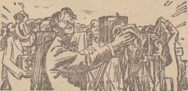
REPORTERZY DO NADCHODZĄCEGO 1934 ROKU. — „PROSIMY O PRZYJEMNY WYRAZ TWARZY“.

Tak samo jeśli wziąć pod uwagę pensje dyrektorów w przedsiębiorstwach prywatnych, wynoszące kilka czy kilkanaście tysięcy złotych miesięcznie, trudno uznać za wygórowaną pensję ministra, wynoszącą 4.000 zł. miesięcznie, czy też uposażenie premiera w wysokości 6.000 zł. miesięcznie.