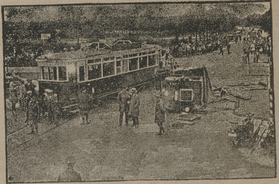
Depesze doniosły o zaburzeniach w Argentynie, które dzięki szybkiej interwencji policji zostały w zaroдку stłumione. Na ilustracji dwa fragmenty z zajęć ulicznych w czasie zaburzeń.