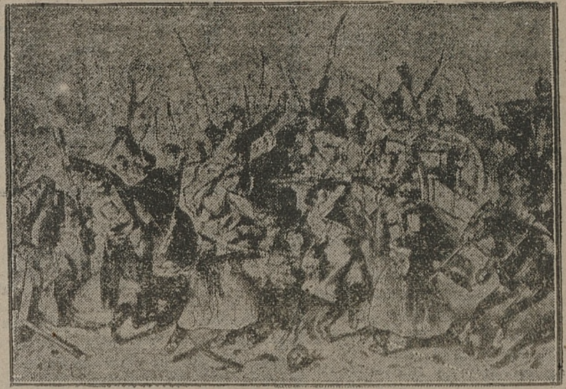
Starcia powstańców 1863 r. z Moskalami.

W związku z unormowaniem przez Zakład Ubezpieczenia Emerytalnego Robotników czynności Ubezpieczalni Społecznych przy zatwierdzeniu rozszereżeń o zapomogi pośmiertne, przewidziane w art. 166 ustawy o ubezpieczeniu społecznym. Dyrekcja Ubezpieczalni Społecznej w Sosnowcu podaje do wiadomości ubezpieczonych treść tego artykułu: