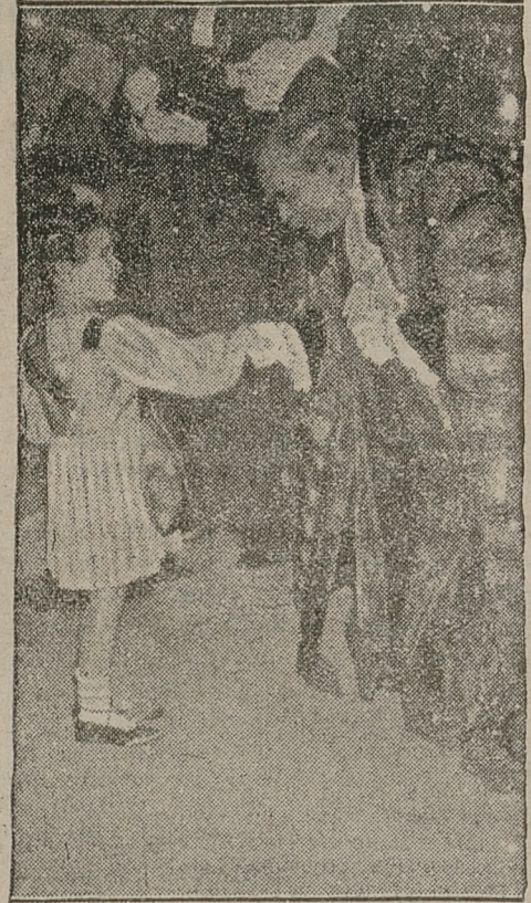
W domu Burmistrza Londynu rokrocznie urządza się bal kostiumowy dla dzieci. Burmistrz, sir Stefan Kilik przyjmuje osobiście miłych gości w urzędowym stroju.

TRADYCYJNY BAL KOSTJUMOWY DZIECI U BURMISTRZA LONDONU