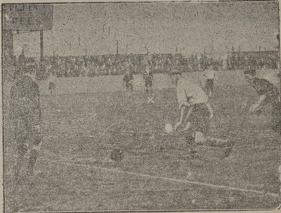
W Anglii odbyły się zawody piłkarskie, którym „patronowało” dwóch sędziów. Na zdjęciu: jeden sędzia na lewo, drugi oznaczony krzyżykiem