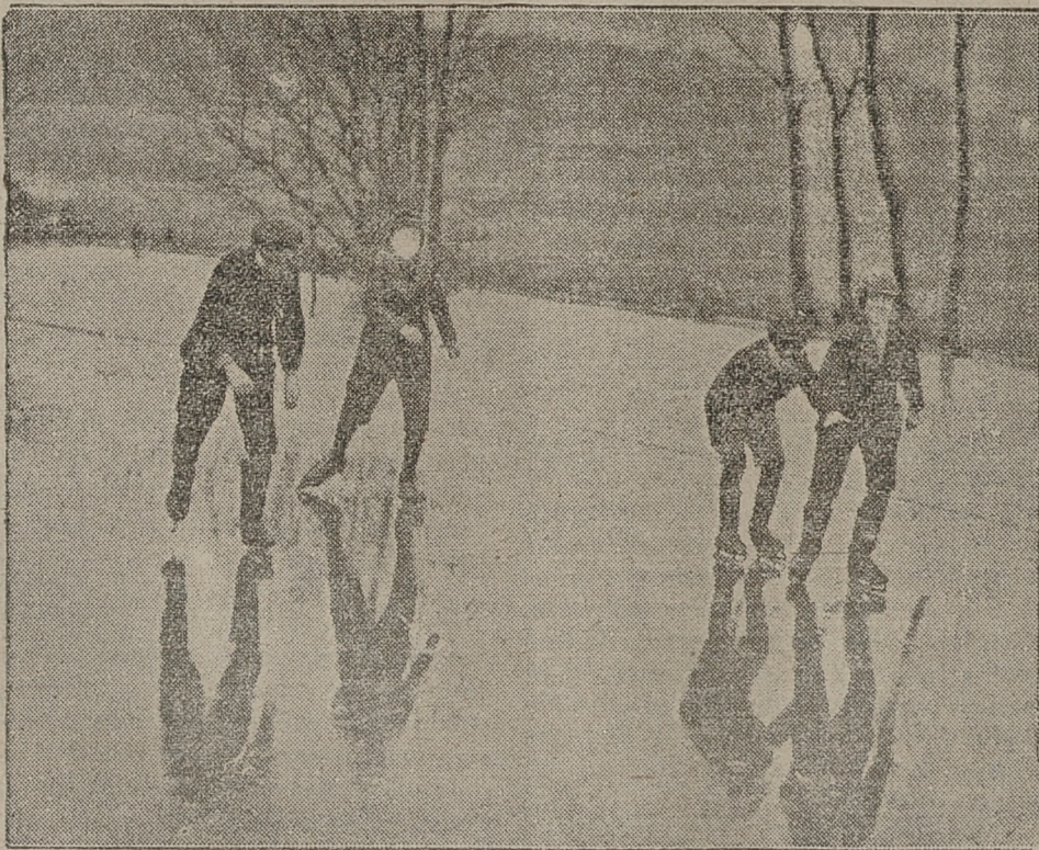
Chłopcy więcej korzystają również z przyjemności, jakie im nastręcza zima. Oto kilku chłopców ślizga się na zamrzniętym stawie.