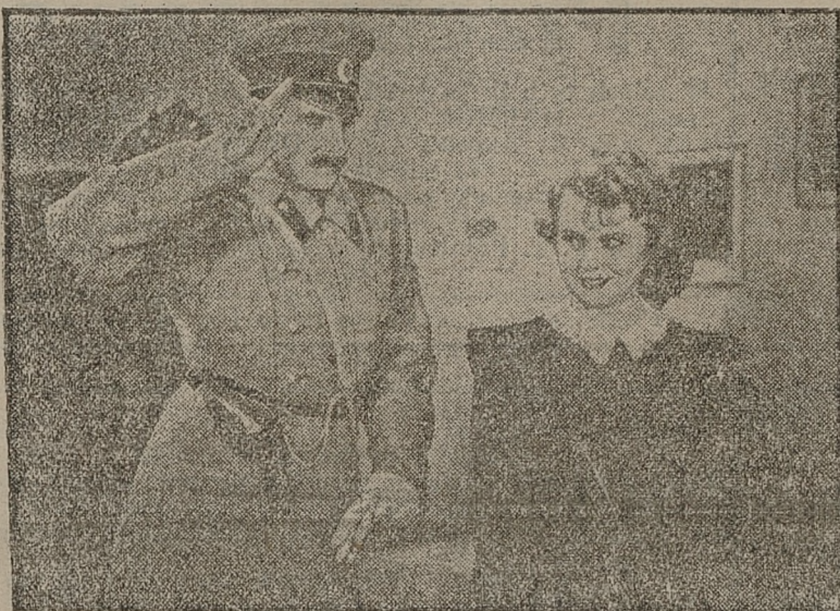
Scena z filmu polskiego „MŁODY LAS”

PIANINA „Pettinga” sprzedaje na niezwykle dogodnych warunkach. Przedstawiciel Kagan, Będzin, Małachowskiego 9.