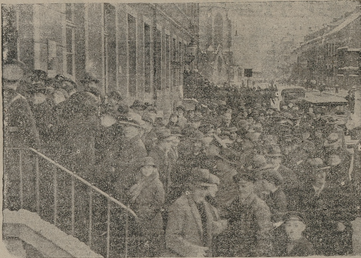
W dniu wyborytu w Zagłębiu Saary tworzyły się długie ogonki głosujących przy wszystkich lokalach wyborcz.