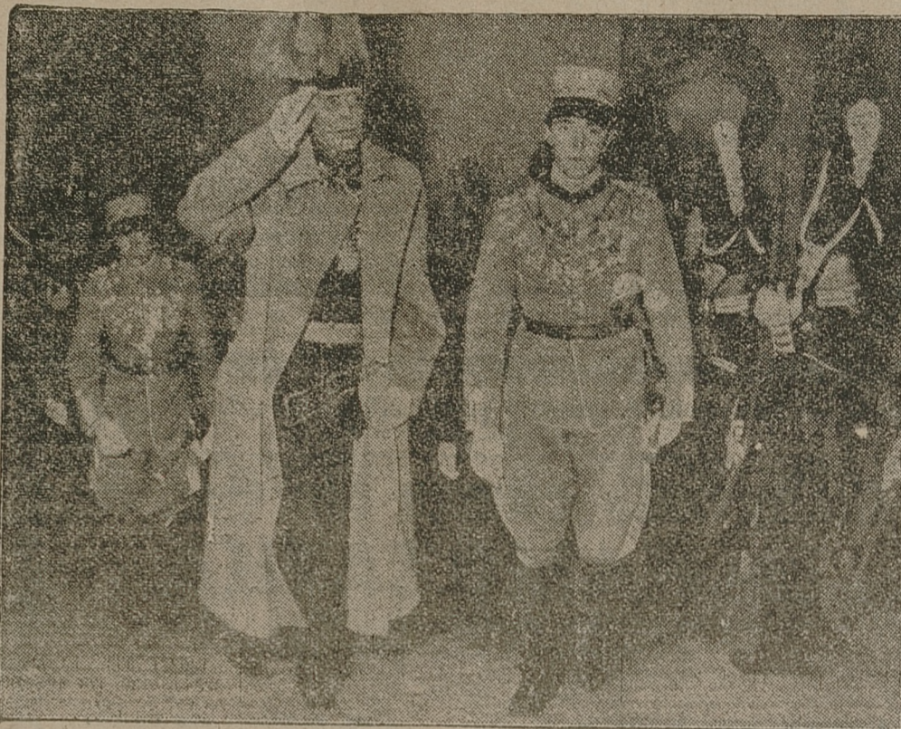
Parlament szwedzki obchodzi sędziwą pięćsetną rocznicę swego istnienia. Pierwszy parlament szwedzki, t. zw. Rigstag powołany został w 1435 r. Na zdjęciu król szwedzki Gustaw, w towarzystwie swego siostrzeńca Gustawa Adolfa udaje się na uroczyste posiedzenie parlamentu.