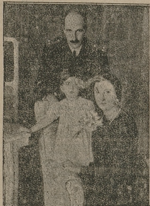
Rodzina królewska w Bułgarii święciła przed kilkoma dniami uroczystość drugą rocznicę urodzin księżniczki Marji Luizy. Zdjęcie nasze przedstawia króla Borysa III, jego małżonkę Giovannę, oraz ich córeczkę — Marję Luizę.