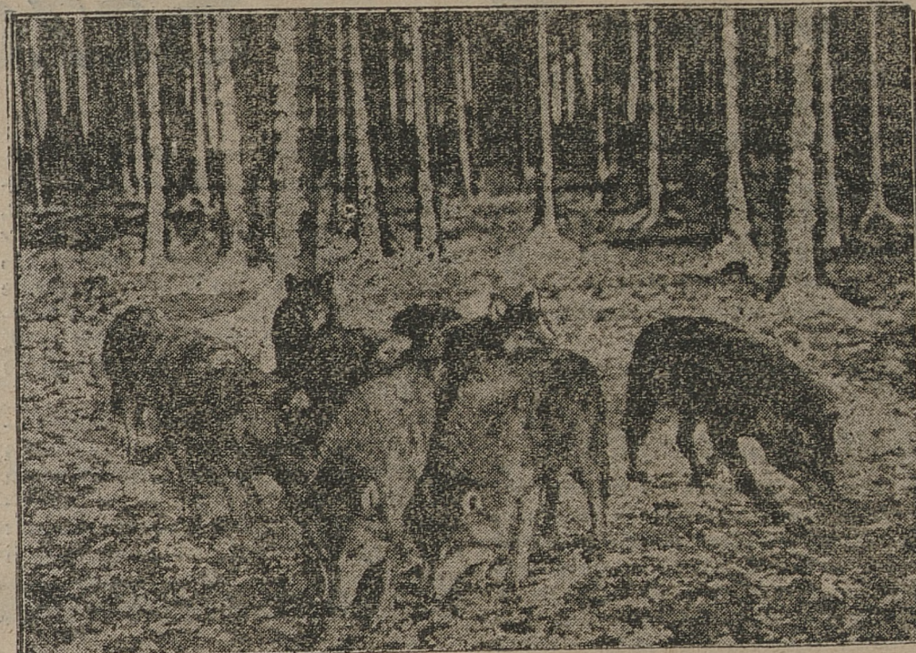
Mrozy dały się we znaki nie tylko ludziom, lecz i zwierzętom. Na zdjęciu gromada wilków w poszukiwaniu żeru — zapędziła się aż pod opiótkę wiejskie.

Wobec zbliżania się dorocznego spotkania wioślarskiego między studentami uniwersytetów w Oxfordzie i Cambridge, załoga Oxfordu już rozpoczęła trening na Tamizie, jak to widzimy na ilustracji. Wyścig ten jest jednym z największych w świecie wydarzeń sportowych.