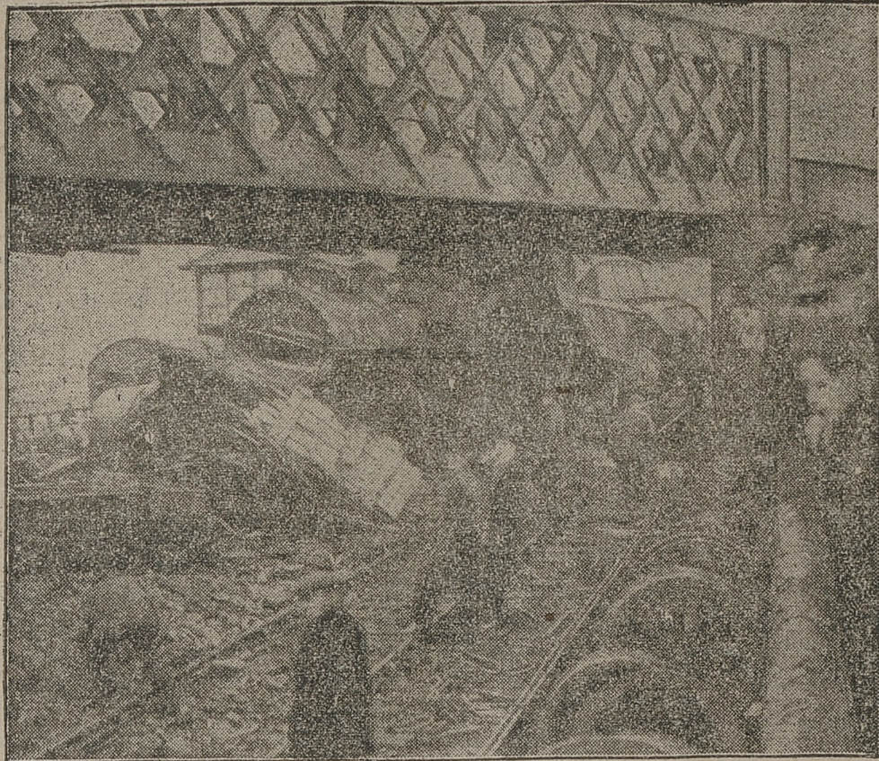
W Szkocji zderzyły się ze sobą dwa pociągi towarowe. Wypadku z ludźmi na szczęście nie było. Na zdjęciu oczyszczanie toru kolejowego z gruzów i połamanych części wagonów.