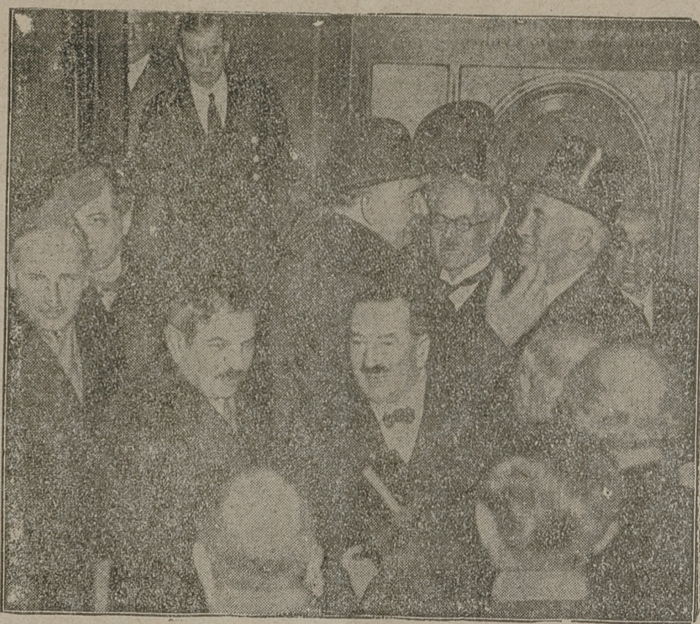
Do Londynu przybyli premier Flandrii i min. Laval. Na dworcu obu gości francuskich powitał premier Mac Donald i min. Simon. Na zdjęciu premier Flandrii (w melniku) w rozmowie z min. Simonem, na przedzie min. Laval (bez kapelusza).