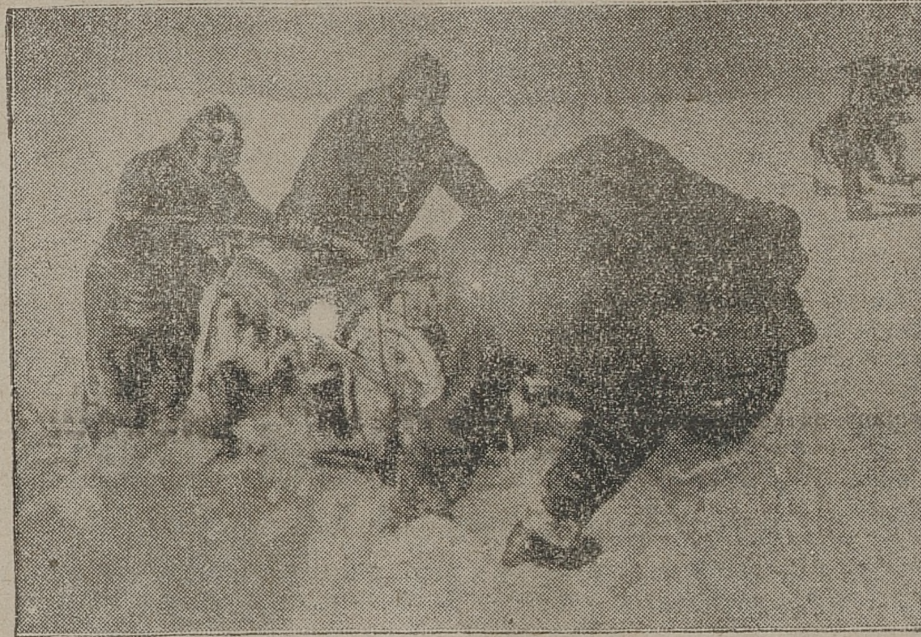
W Niemczech drogi pokryły się grubą warstwą śniegu, utrudniając komunikację. Na zdjęciu — motocykl, który wpadł w fosę i zarył się głęboko w puszystym śniegu.