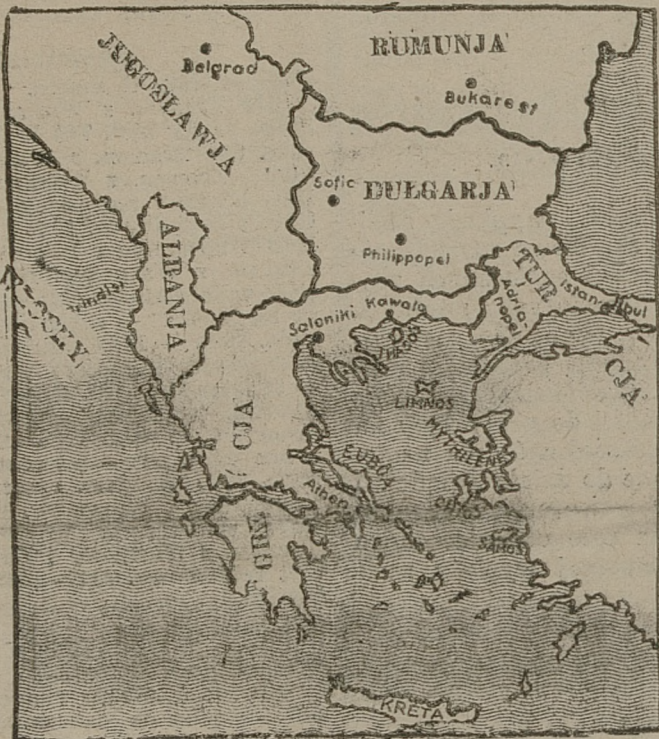
Mapka sytuacyjna z terenu walk w Grecji.

AJACIO, 10. 3. PAT. Krażownik „Tourville“ otrzymał nakaz udania się na wyspę Kretę, by zapewnić opiekę obywatelom francuskim.