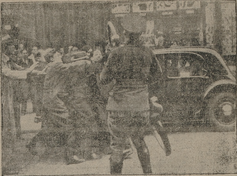
Studenty francuscy demonstrują nadal przeciwko endoziemcom. — Na zdjęciu — policja rozprasza demonstrantów, którzy pobili kilku żydów — studentów.