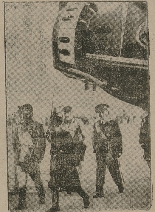
Mussolini dokonał w Littorio przeglądu bombardowych samolotów wojskowych. Na zdjęciu Il Duce w otoczeniu oficerów przechodzi przed „frontem” maszyn lotniczych.